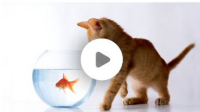
Wat is phishing?

Ga naar YouTube en type bij de zoekbalk 'Eurowijs + titel van het filmpje'.